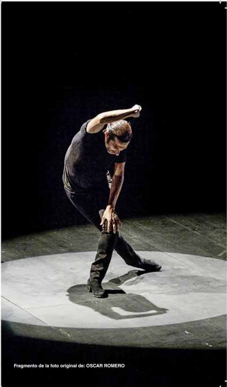
Fragmento de la foto original de: OSCAR ROMERO