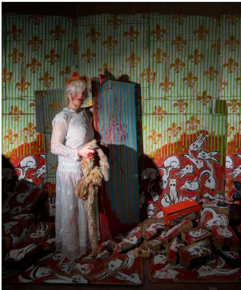
¿Qué tienes en contra de los conejos? /What Do You Have Against Rabbits?

80x100 cm Fotografía sobre papel Hahnemühle / 2023