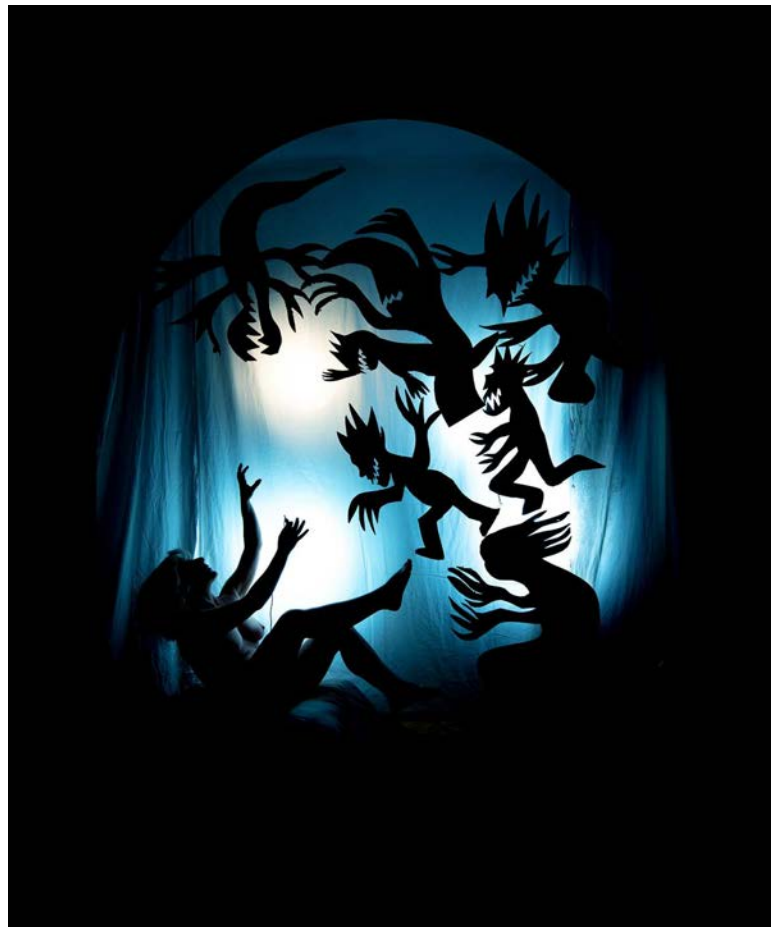
60x50 cm Fotografía sobre papel Hahnemühle / 2023