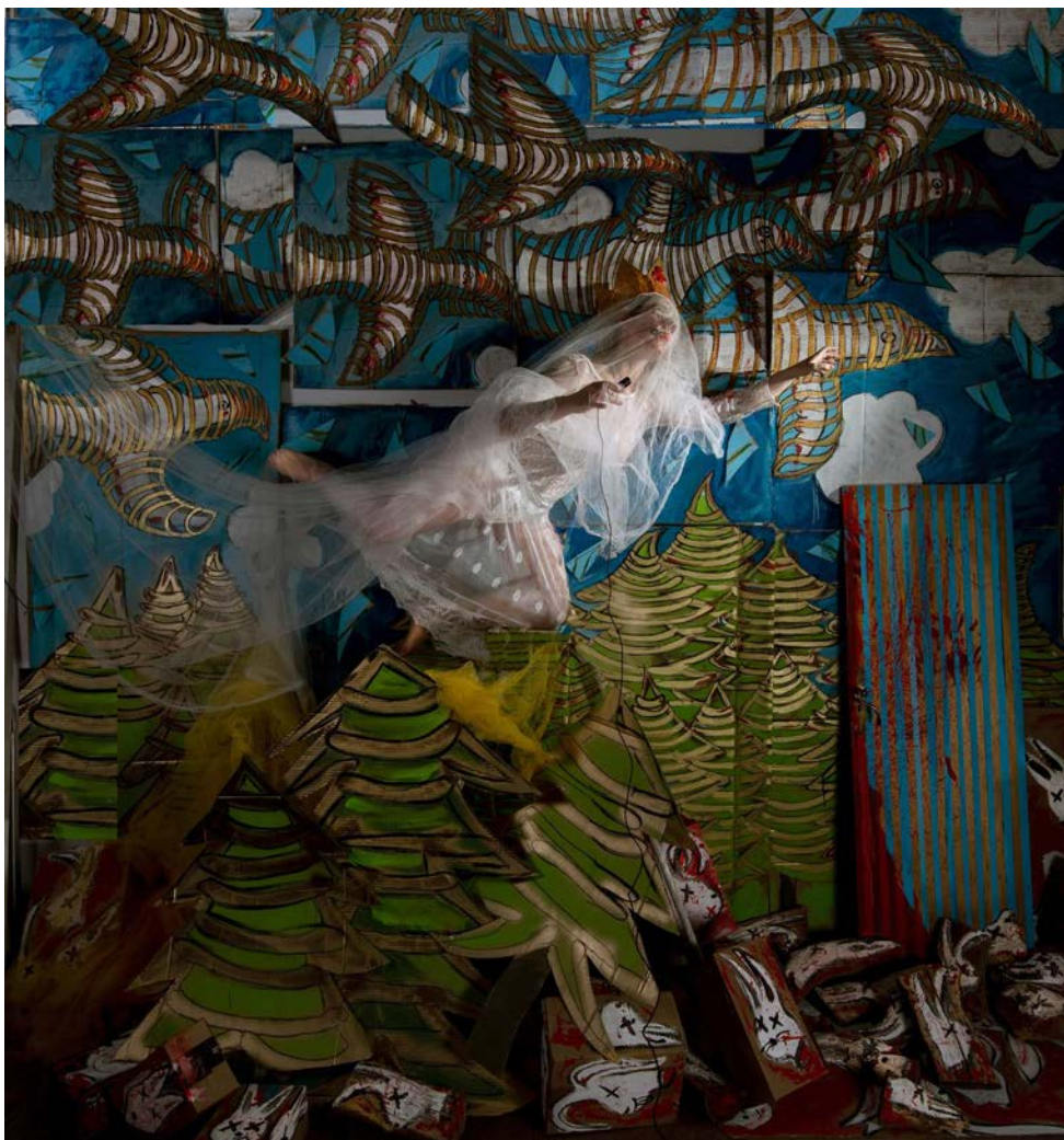
El rescate / The Rescue 90x84 cm Fotografía sobre papel Hahnemühle / 2023