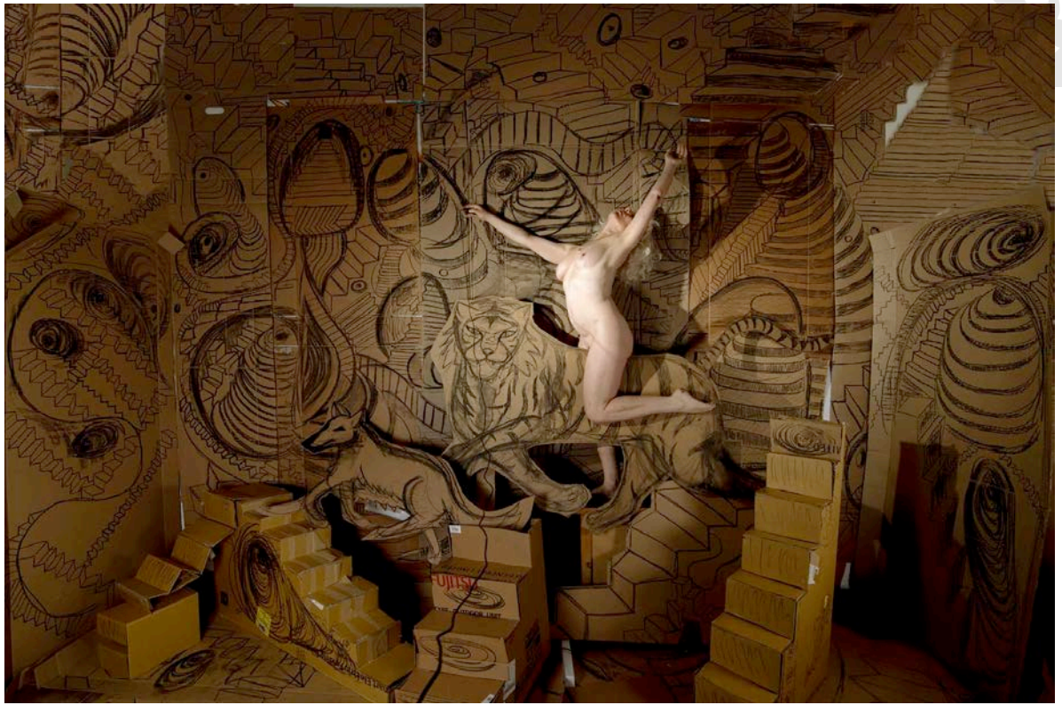
Cabalgando el tigre / Riding The Tiger