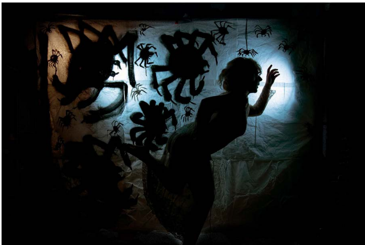
La invasión de arañas gigantes que rebotan en las paredes /The Invasion Of Giant Spiders That Bounce Of The Walls