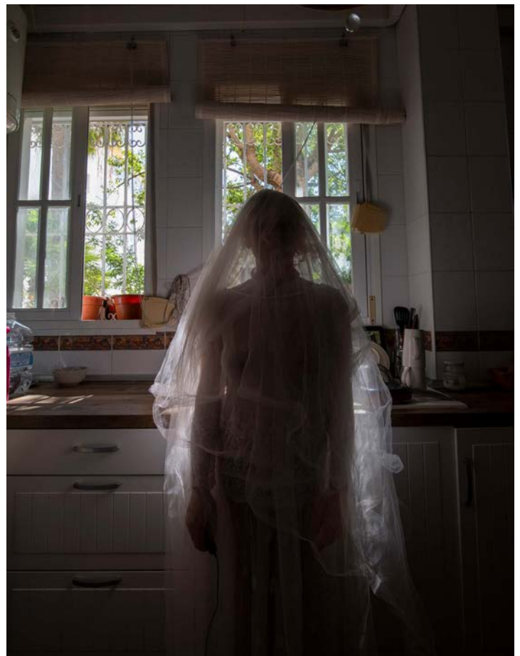
90x70cm Hahnemühle Mattfibre