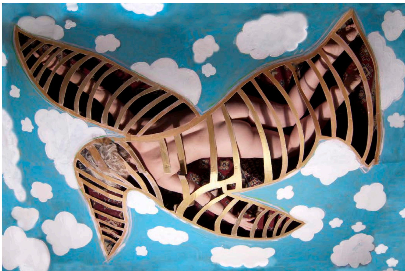
100 x 66 cm Fotografia sobre papel Hahnemühle / 2020