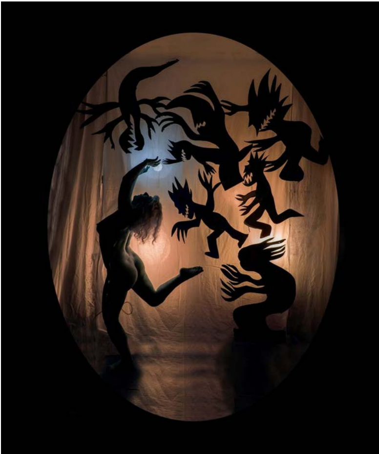
Barbarella I 60x50 cm Fotografía sobre papel Hahnemühle / 2023