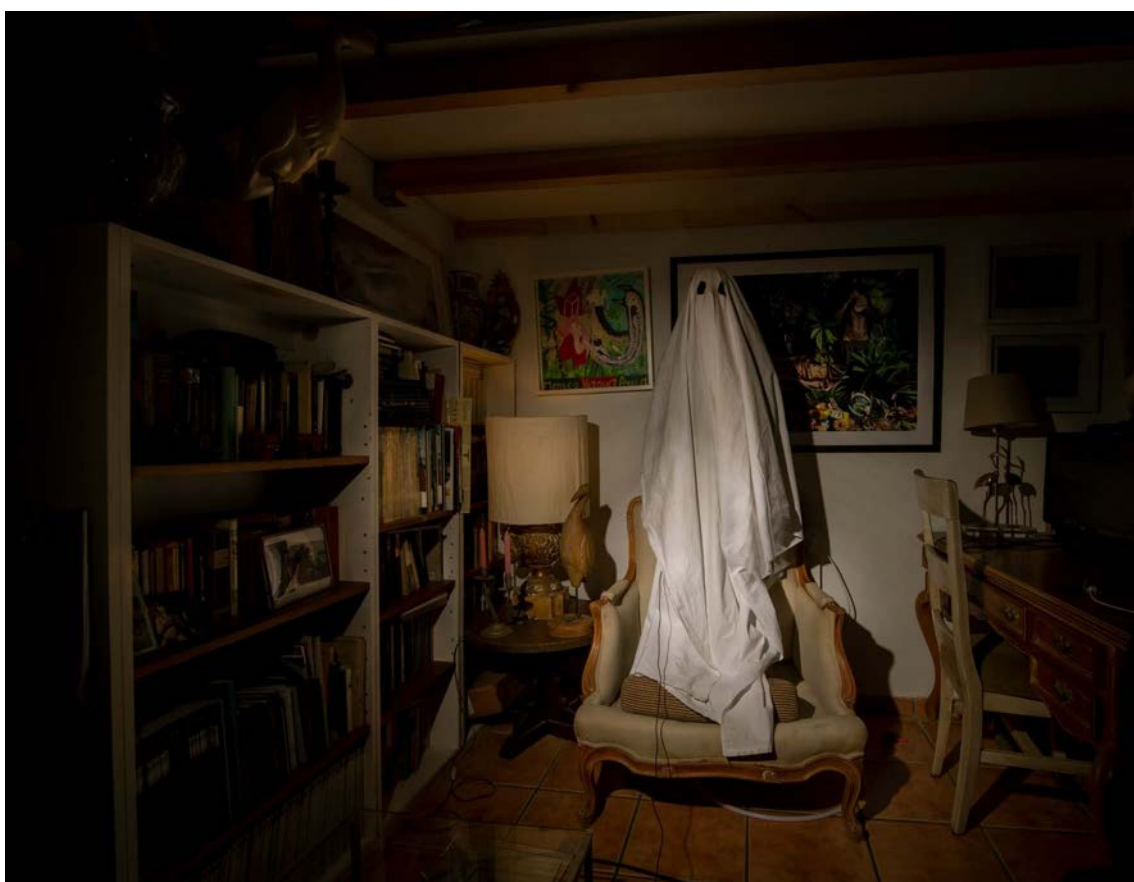
60x80 cm Fotografía sobre papel Hahnemühle