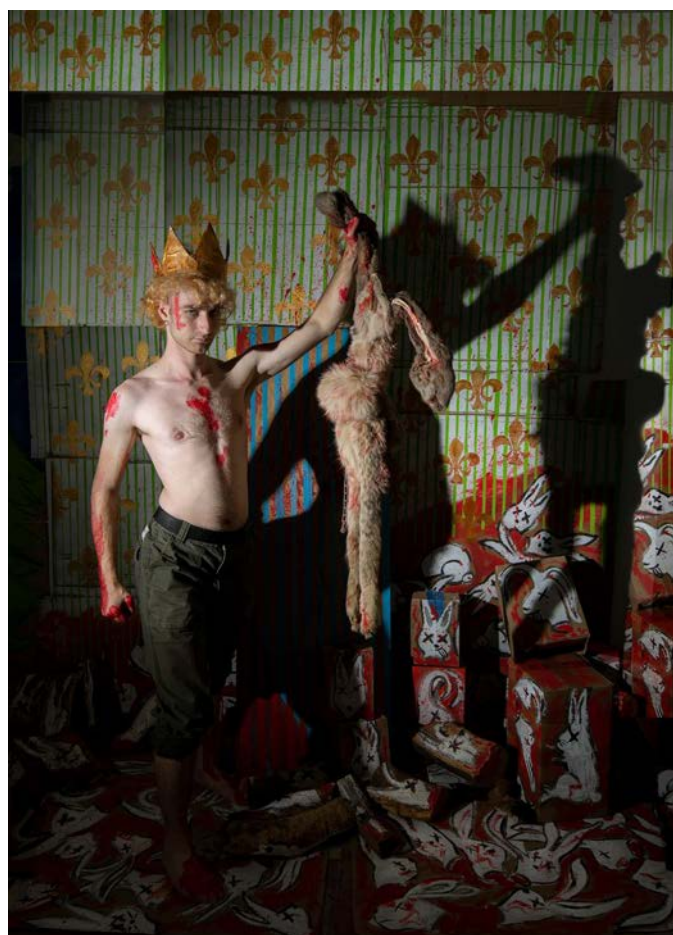
Death Blow By Slamming Door 100x70 cm Fotografía sobre papel Hahnemühle / 2023

80x100 cm Fotografía sobre papel Hahnemühle / 2023