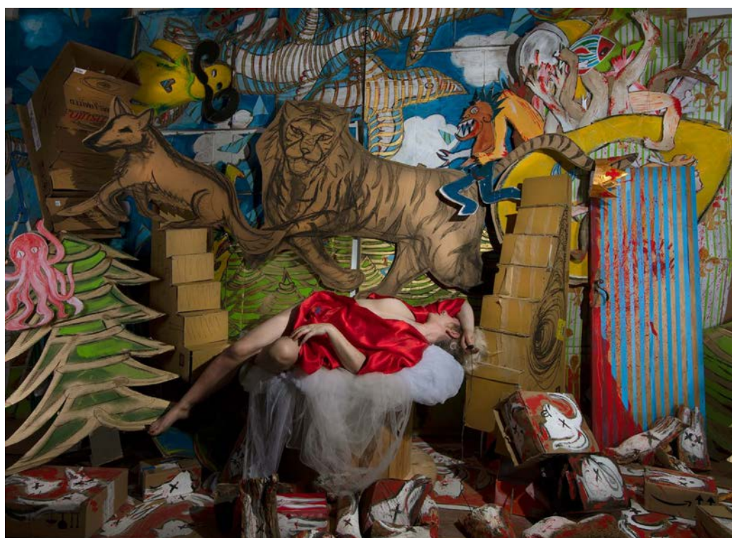
En los sueños Me encontraré / I Will Find Myself In Dreams 72x100 cm Fotografía sobre papel Hahnemühle / 2023