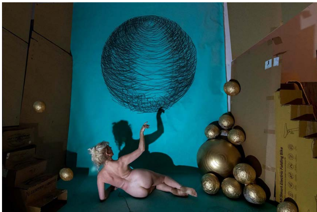
Chernobog 66x100 cm Fotografía sobre papel Hahnemühle / 2023