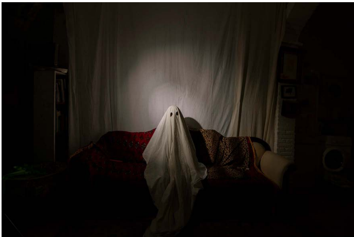
60x90 cm Hahnemühle Mattfibre