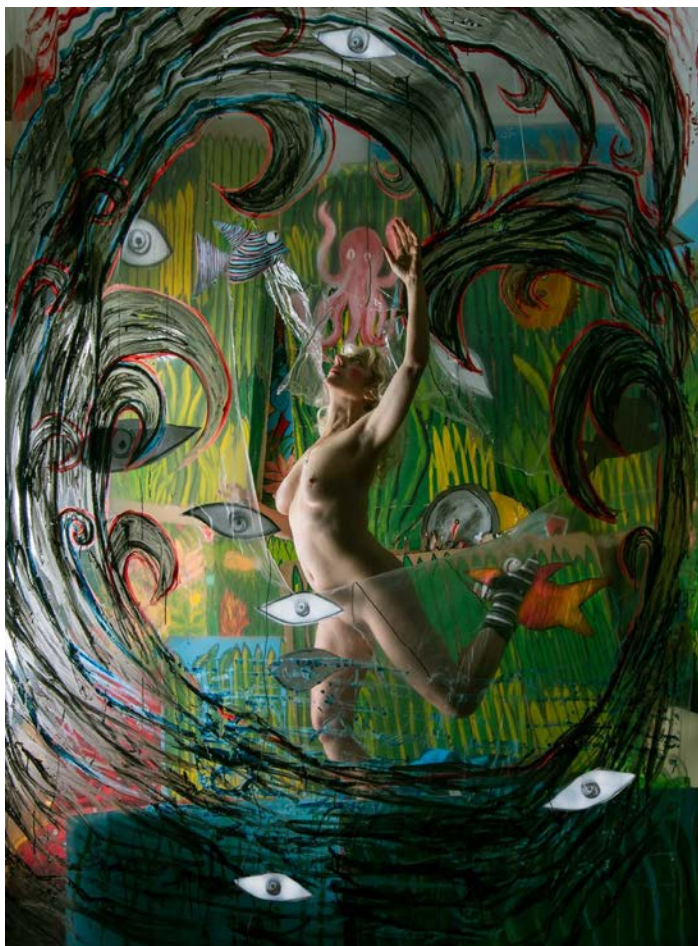
El fin del mundo y no tengo miedo / The End of The World And I'm Not Afraid