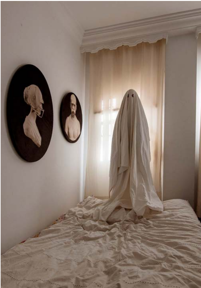
70x50 cm Hahnemühle Mattfibre