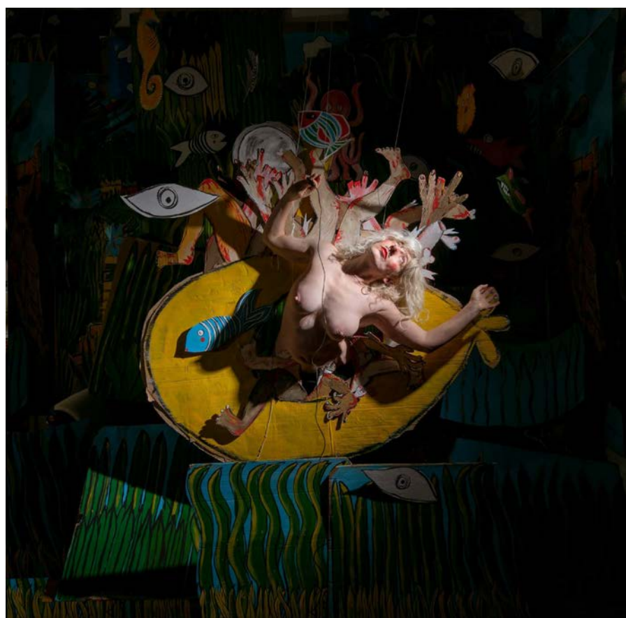
Nazi Im U- Boot /What Have I Done?

Fotografía sobre papel Hahnemühle / 2023