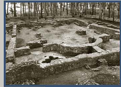
Fig. 2 Fotografía de la Basílica.