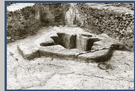
Fig. 3 Fotografía de la pila bautismal, R. Puertas Tricas.