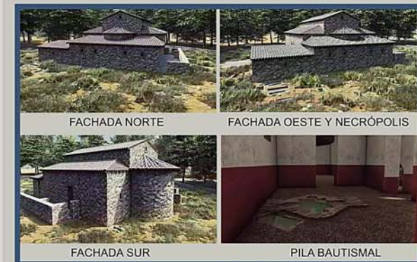
Fig.4 Recreación e interpretación del edificio según J. Soto Portella, A. Cirtrano Caliani, B. Hernan Saez y M. Requena Cueto.