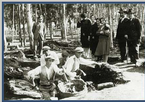
Fig.4 Las excavaciones despertaron el interés de vecinos y forasteros que visitaron los avances del descubrimiento.