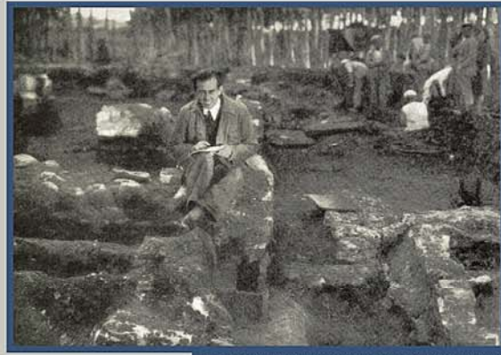
Fig.3 Trabajos de documentación durante las intervenciones arqueológicas realizadas por J. Pérez de Barradas.