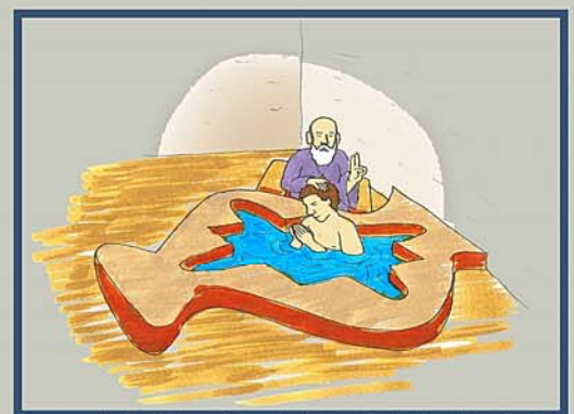
Fig. 3. Recreación de un bautismo en Vega del Mar, A. Pérez Ordoñez.