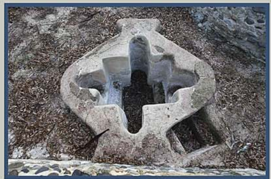
Fig. 2 Vista cenital de la pila bautismal.