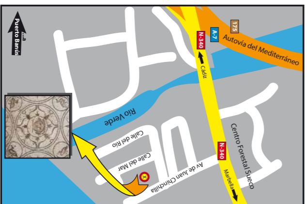
Villa Romana de Río Verde