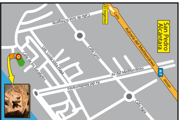
Basílica de Vega del Mar