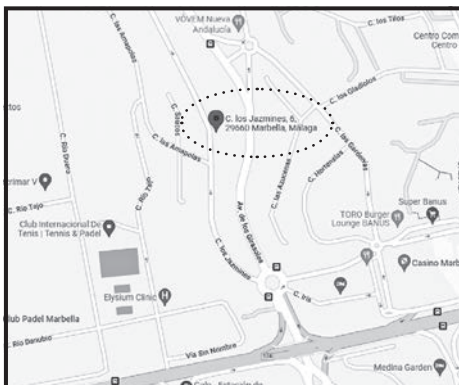
Nueva Andalucía: C/ Los Jazmines, 6 Teléfono: 952.938857