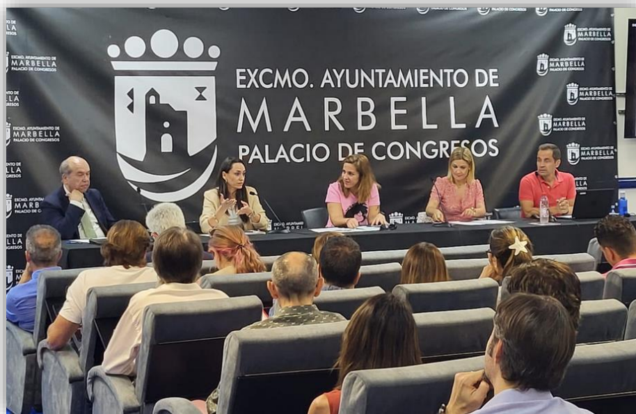
-Comisión Municipal de Absentismo 2023-