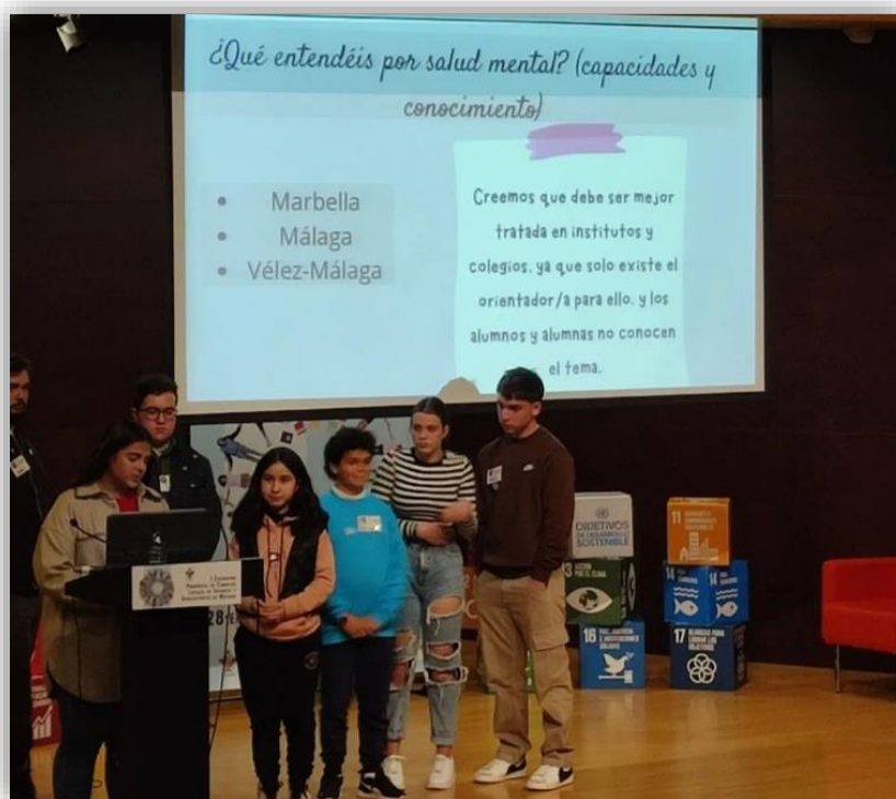
-Encuentro Provincial de CLIAs (trabajando la Salud Mental) -