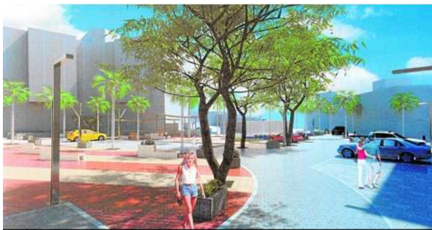
RECREACIÓN PLAZA DE LA IGLESIA DE DIVINA PASTORA

Conlleva transformaciones importantes en la barriada Divina Pastora, poniendo en valor espacios urbanos como lugares de encuentro y reactivación de la economía. Obras adjudicadas por importe de 1,6 millones.